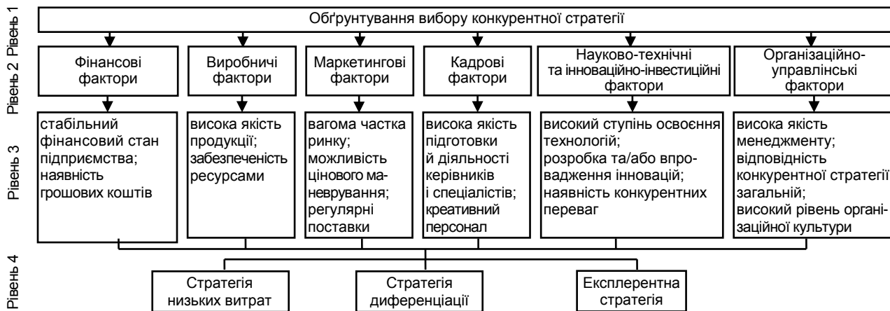
Рис. 3. Ієрархічна структура для прийняття рішення стосовно вибору конкурентної стратегії за вигодами