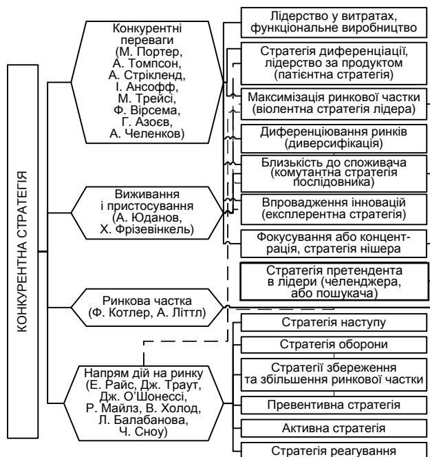
Рис. 2. Класифікація конкурентних стратегій

Ієрархічна структура для прийняття рішення стосовно вибору конкурентної стратегії за вигодами та витратами наведена на рис. 3 і 4 відповідно.