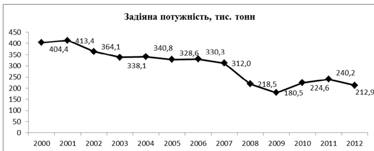
Рисунок 2 – Динаміка виробничої потужності цукрових заводів, тис. т

Динаміка зміни сумарної виробничої потужності працюючих цукрових заводів в Україні протягом 2000–2012 рр. представлена на рис. 2.