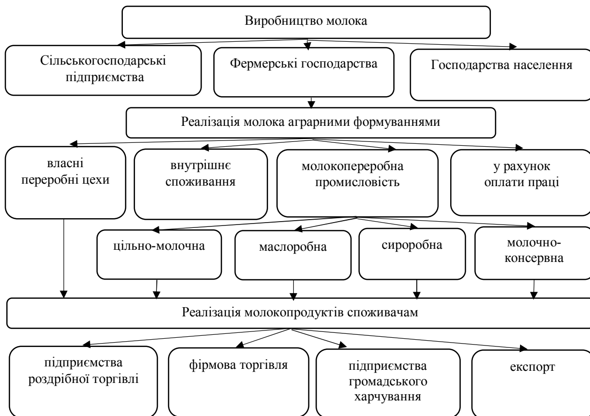
Рисунок. 1 – Схема молокопереробного підкомплексу Черкаської області [1]

необхіднішою стає потреба в об'єднанні суб'єктів аграрно-промислового виробництва відповідного продуктового підкомплексу в єдине ціле.