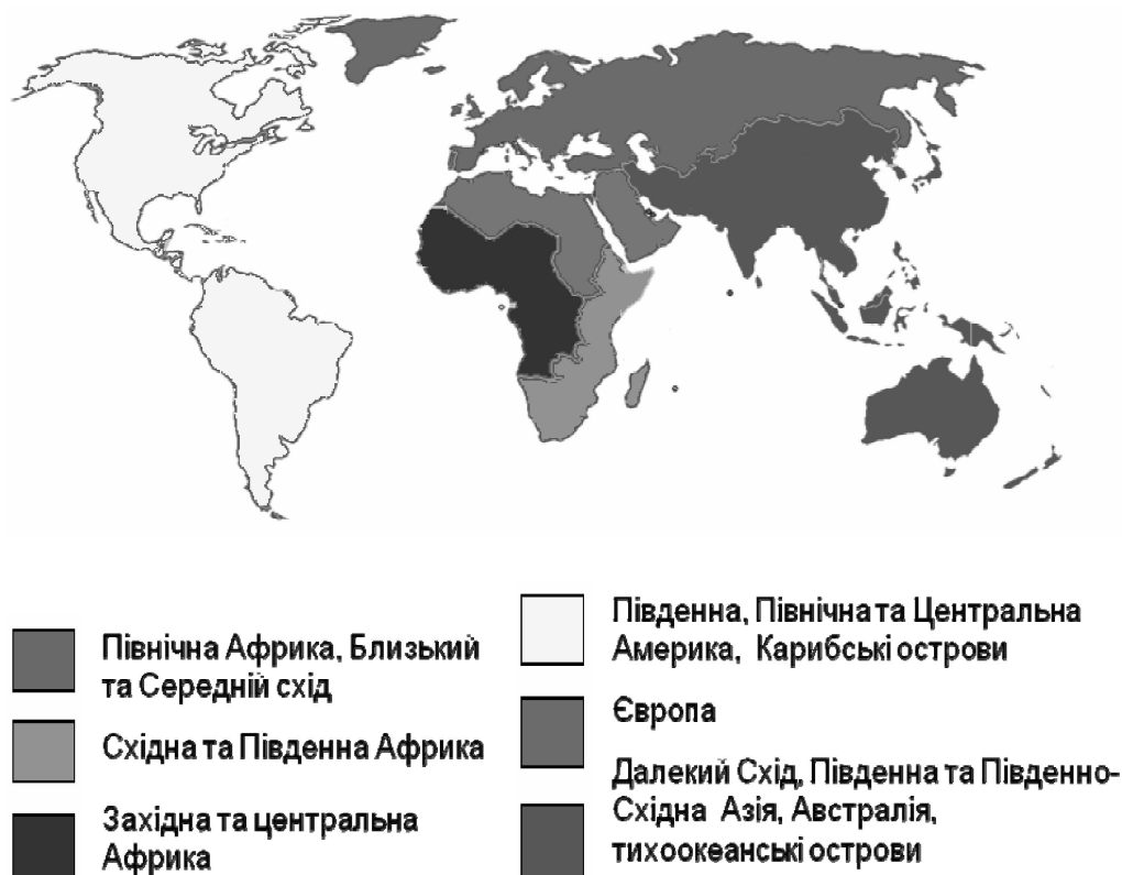
Мал. 1. Поділ країн за ВМО

митної організації для найкращого відбиття її переходу в дійсно глобальний міжурядовий інститут [5].