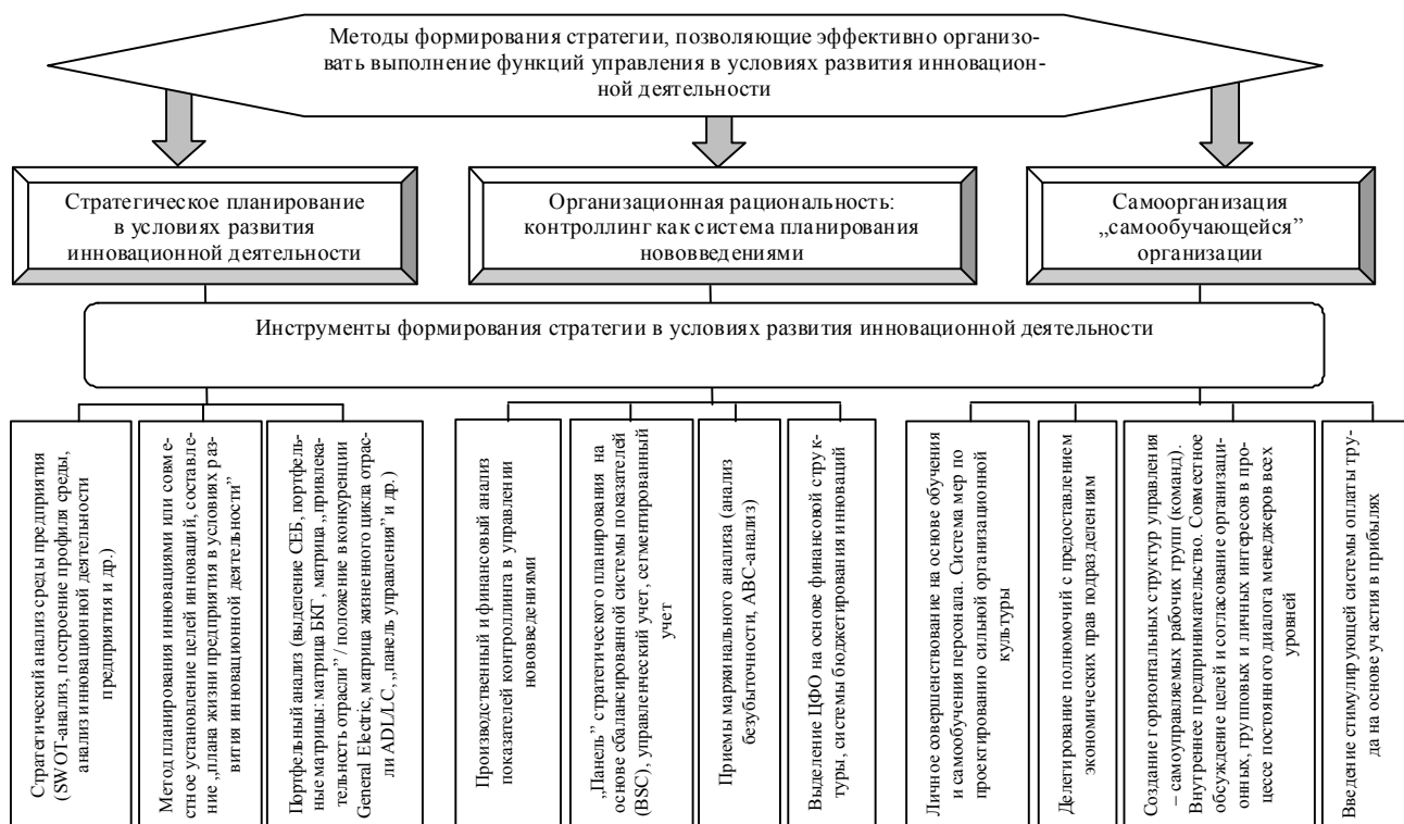
Рис. 2. Классификация методов и инструментов формирования стратегии в условиях развития инновационной деятельности

В настоящее время накоплен значительный объем методических средств и инструментов, используемых