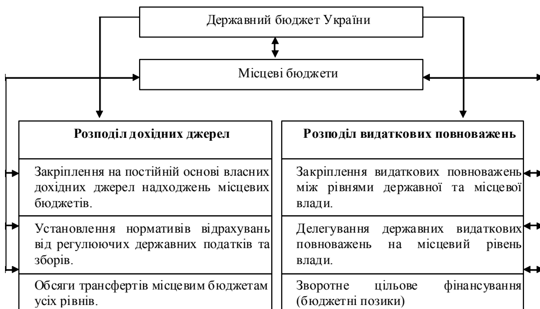
Рис. 1. Механізм вертикального бюджетного регулювання в Україні (Складено автором)

Запропонований механізм має теоретичне і практичне значення, дозволяє комплексно підійти до розгляду особливостей організації горизонтального бюджетного вирівнювання на місцевому рівні. З теоретичних позицій запропонований механізм розширює науковий кругозір щодо побудови ефективної системи міжбюджетних стосунків на рівні територіальних утворень. З практичних позицій розроблений механізм дозволяє виділити і структурувати процес обґрунто-