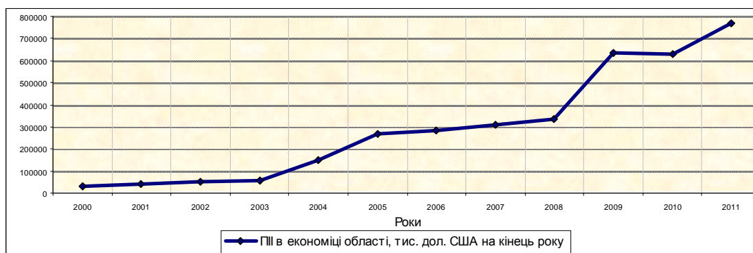
Рис. 2. Динаміка прямих іноземних інвестицій в економіку Луганської області за 2000 – 2011 рр. [5]