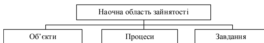
Рис. 1. Структура логіко-семантичної моделі наочної області зайнятості

Логіко-семантичний аналіз дозволяє продовжити класифікацію на наступному рівні [6], де потреби економічно активного населення класифікуються на зайняте / незайняте економічно активне населення та загальні / індивідуальні його потреби; умови праці – на виробничі, фінансові, побутові, дозвілєві умови праці та трансфер до місця праці; найцікавішими з погляду дослідження трансформації інституту зайнятості на сучасному ринку праці є нестандартні форми зайнятості, класифікація яких складається з 11 елементів, і представлена такими формами: індивідуальна трудова діяльність; підприємництво у сфері малого бізнесу; бездоговірні форми зайнятості;