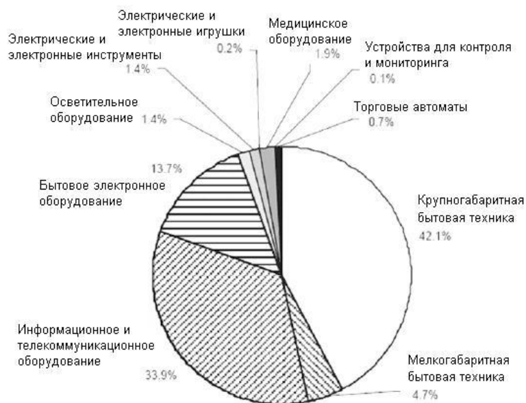
Рис. 1. Состав электронных отходов по категориям электрического и электронного оборудования

Персональные компьютеры в структуре вычислительной техники занимают абсолютное преимущество – 99,9%. В 2009 г. количество персональных компьютеров, находящихся на балансах предприятий и орга-