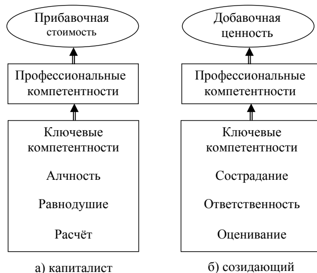
Рис. 3. Сравнение архетипов наноэкономики

Например, необходимо трансформировать сельский дом с печным отоплением (термический КПД – 0,85) в зелёную усадьбу. Для созидающего ноосферу, путь газификации неприемлем, потому