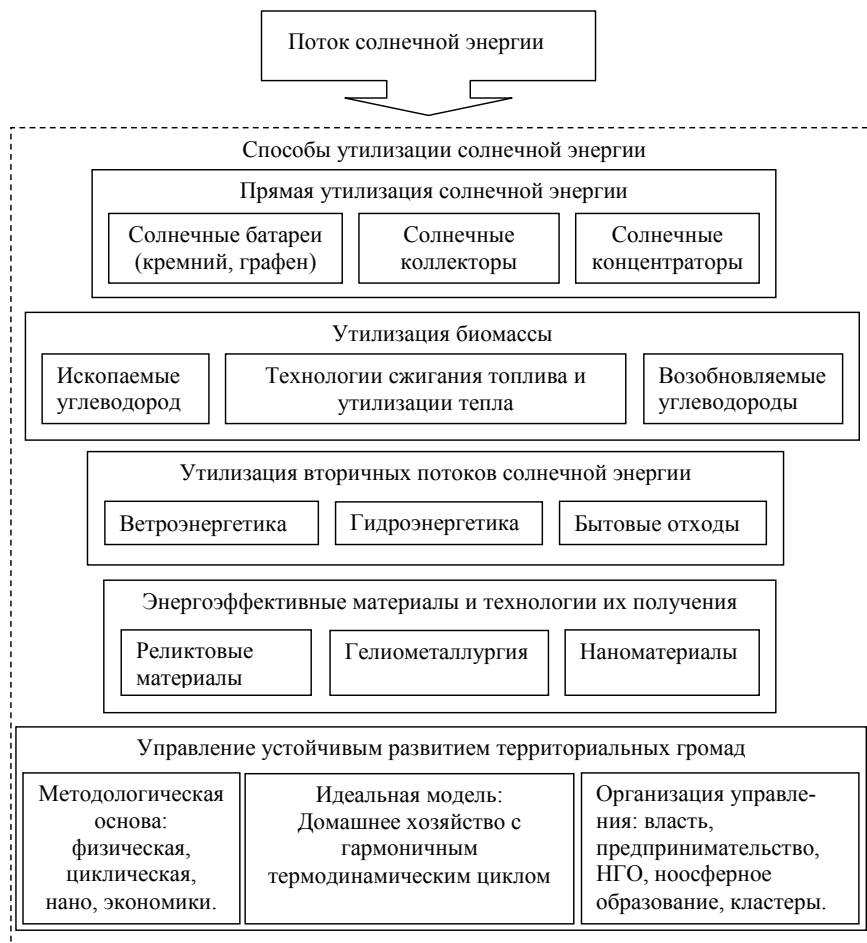
Рис. 4. Поле знаний для формирования профессиональных компетентностей создающих ноосферу