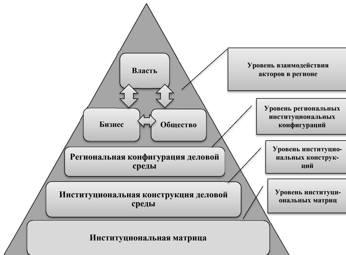
Рис. 1. «Пирамида» формирования институтов деловой среды региона

Таким образом, в рамках данного подхода процесс формирования и дальнейшего функционирования региональных институтов деловой среды можно представить в виде своеобразной пирамиды разделенной на несколько уровней, каждый из которых оказывает свое влияние на конкретную модель взаимодействия экономических акторов в регионе и муниципальном образовании, которая, по сути, и определяет параметры относительной эффективности (неэффективности) региональной деловой среды региона (рис. 1).