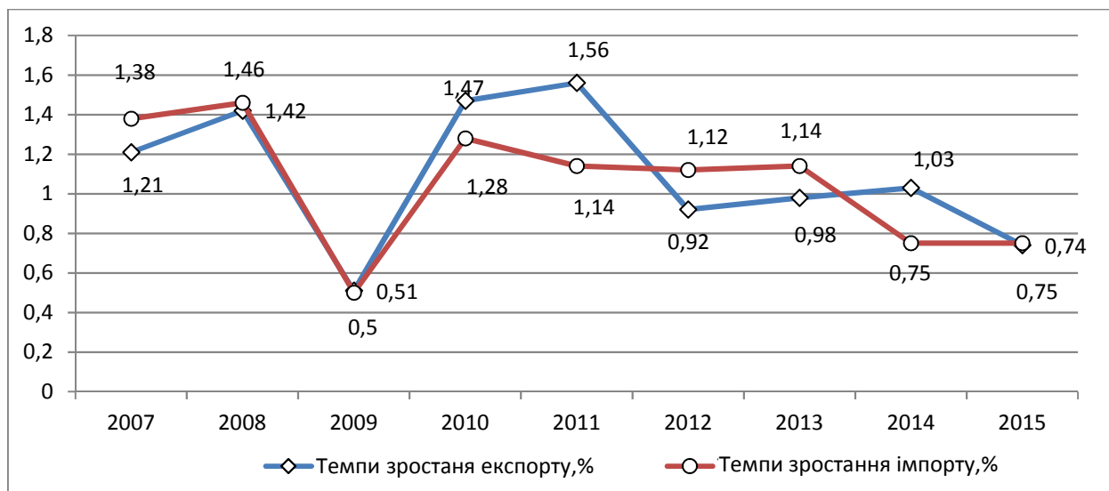
Рис. 1. Динаміка темпів зростання експорту та імпорту України та Польщі

Одночасне зростання питомої ваги експорту та імпорту відбувається за рахунок майже одночасного зростання експорту та імпорту, що наведено на рис. 1.