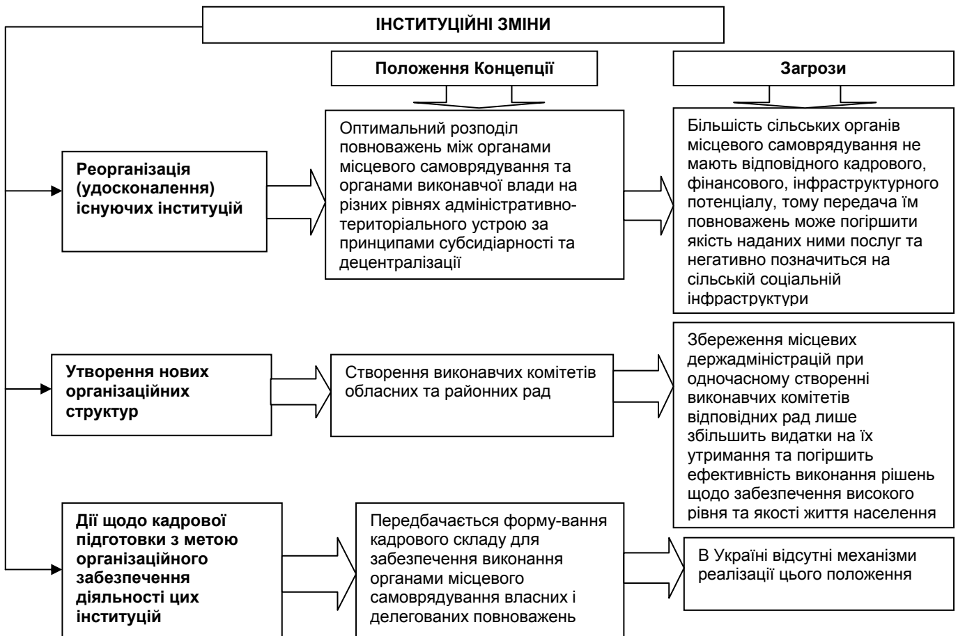
Рисунок 2. Можливі негативні наслідки від реалізації Концепції реформування місцевого самоврядування та територіальної організації влади в Україні

Нами було проаналізовано можливі загрози при реалізації цієї Концепції (рис. 2). Так, передбачається оптимальний розподіл повноважень між органами місцевого самоврядування та органами виконавчої влади на різних рівнях адміністративно-територіального устрою за принципами субсидіарності та децентралізації. Проте така передача повноважень на місцевий рівень може негативно позначитися на переважній більшості сільських населених пунктів, тому що сільські органи місцевого самоврядування мають низький інфраструктурний потенціал. Реалізувати це положення Концепції без погіршення якості наданих населенню послуг можливо лише після створення повноцінної, ефективної та самодостатньої економічної системи.