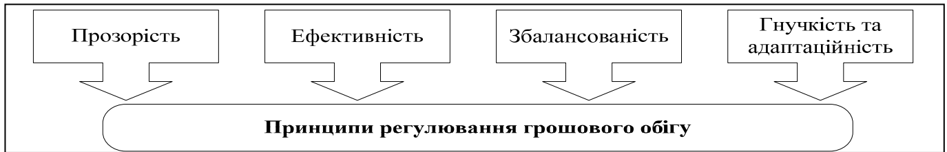
Рисунок 2. Основні принципи регулювання грошового обігу в Україні

Принципами регулювання грошового обігу України з метою його стабілізації є: ефективність; збалансованість; прозорість; адаптаційність. Схематично ці принципи зображені на рис 2.