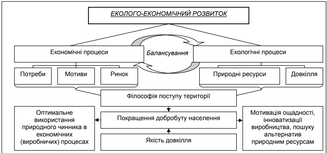
Рисунок 1. Сутність еколого-економічного розвитку*

Співставлення екологічних та економічних процесів потребує конкретизації індикаторів й утвердження відповідних методик, що залишається актуальним напрямом наукових досліджень. З огляду на це особливо цінними нині є розробки практично придатних методик еколого-економічного аналізу . За практичною сутністю вони охоплюють такі складові, як екологічна експертиза, екологічна діагностика, екологічний ситуаційний аналіз, екологічний маркетинговий аналіз, екологічний аудит та екологічний контролінг [6, с. 116]. Актуальними є методичні розробки та їх практичні апробації з розрахунку екологічної місткості (ємкості) територій, що відображає сукупний обсяг споживання природних ресурсів, який природна система здатна витримати без деградації та яка залежить від загальної чисельності населення, кількості технологій і способу життя [1, с. 75].