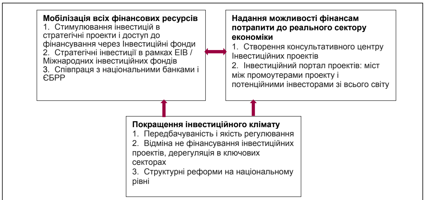
Рисунок 2. Напрямки покращення інвестиційного клімату

Відтак, для підвищення рівня інвестиційної привабливості та активізації інвестиційної діяльності як на екзо-, так і на ендорівнях запропоновано напрямки покращення інвестиційного клімату (рис. 2).