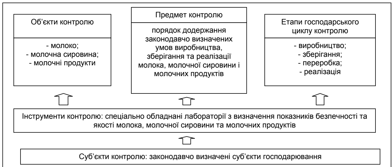
Рисунок 2. Вхідні бар'єри ринку в частині контролю якості та безпечності молока та молочної продукції

Галузевий механізм антимонопольно-конкурентного регулювання спрямований на забезпечення дієвості функціонування її конкурентного середовища. Двома основними складовими зазначеного механізму будуть механізми антимонопольного та конкурентного регулювання. На будь-якому управлінському рівні важливим є визначення ключових періодів для проведення оцінки та визначення порядку внесення коригуючих заходів по кожному виділеному типу умов виробництва.