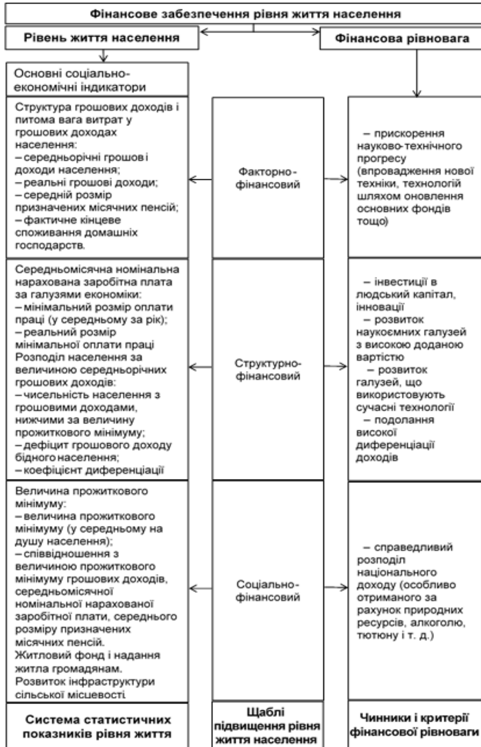
Рисунок 1. Схема взаємозв'язку рівня життя населення та фінансової рівноваги держави*

скореговану на зміну простроченої заборгованості), доходи осіб, зайнятих підприємницькою діяльністю, пенсії, допомоги, стипендії та інші соціальні трансферти, доходи від власності у вигляді відсотків за внесками, цінними паперами, дивідендів та інші доходи. Інші доходи включають обсяг непланових грошових надходжень. Грошові доходи за вирахуванням обов'язкових платежів і внесків є наявними грошовими доходами населення. Досягнення фінансової рівноваги у чистому вигляді не можливе, але це поняття у нашому дослідженні використовується, оскільки усі суб'єкти в системі фінансового забезпечення рівня життя населення зацікавлені в її реалізації. При цьому відбувається постійний процес коригування планів з метою підвищення рівня життя населення.