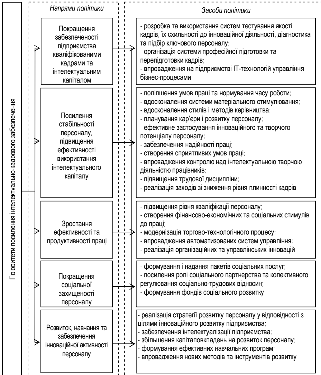
Рис. 2. Пріоритетні напрями та засоби формування інтелектуально-кадрового забезпечення роздрібного торговельного підприємства*

рівня персоналу; розвиток практик співпраці з освітніми, науково-дослідними організаціями та інноваційними структурами; реалізація мотиваційних програм інтелектуальної творчої та інноваційної діяльності персоналу; узгодження принципів корпоративної культури з інтелектуалізацією підприємства);