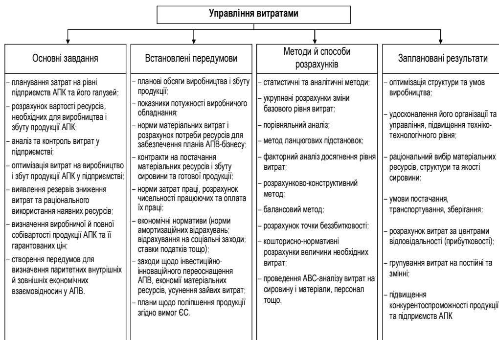
Рис. 2. Структурно-логічна схема управління витратами у агропромислового підприємстві

Опрацювання літературних джерел [1, 2, 4, 5, 6, 7, 14] дало змогу сформулювати основні завдання, загальні передумови, вимоги та інструменти управління витратами у аграрних підприємствах за такою структурно-логічною схемою (рис. 2).