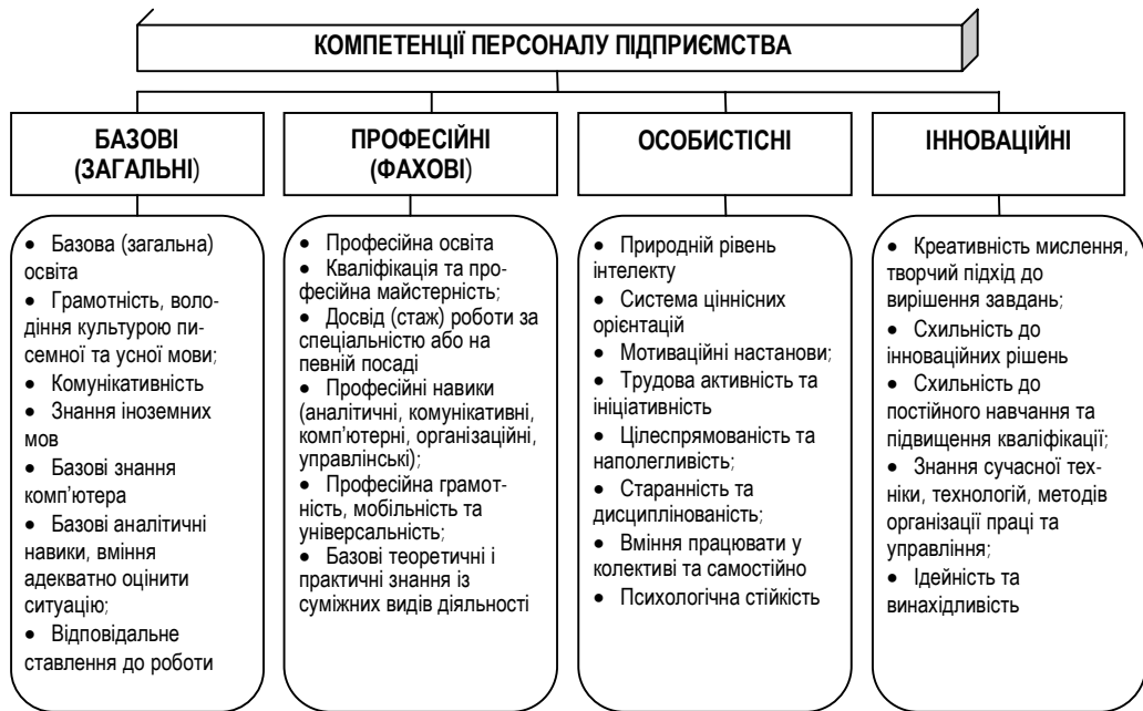
Рис. 1. Класифікація компетенцій персоналу*