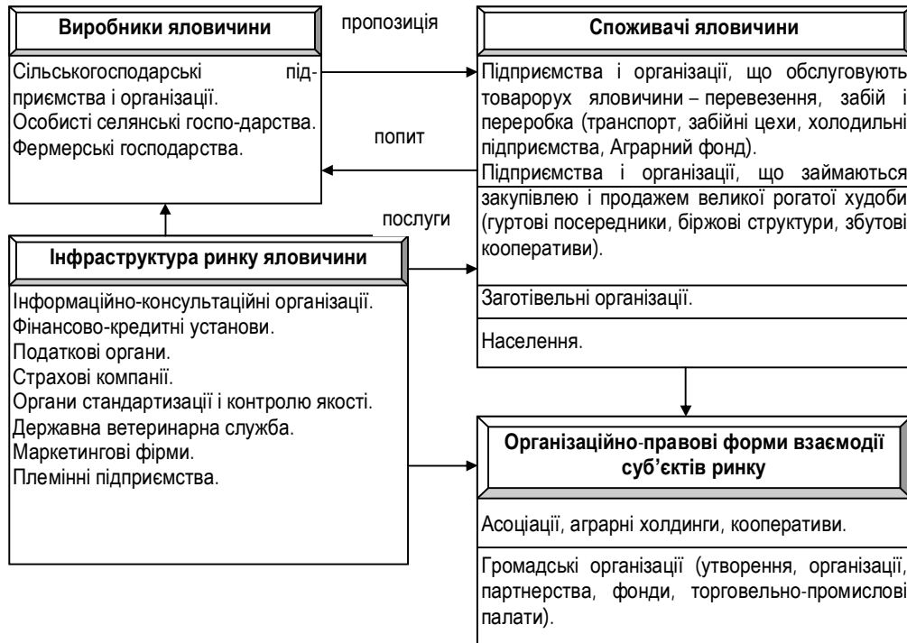
Рис. 2. Організаційне забезпечення функціонування м'ясного скотарства*