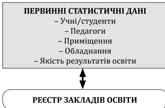
Рис. 1. Реєстр закладів освіти та освітня статистика

ньої. Передбачається, що відтепер не Державний комітет статистики України, а саме Інститут освітньої аналітики буде збирати первинні статистичні відомості. Ці відомості мають бути достатньо деталізовані. Зараз же за відомими статистичними формами збирається узагальнена статистика, достатня для оцінки та прогнозування соціального-економічного розвитку держави