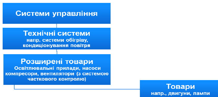
Рис. 1 Типи та ієрархія стандартів

Предмети стандартизації – можуть бути різноманітні (загальний опис - див. Рис.1), це: