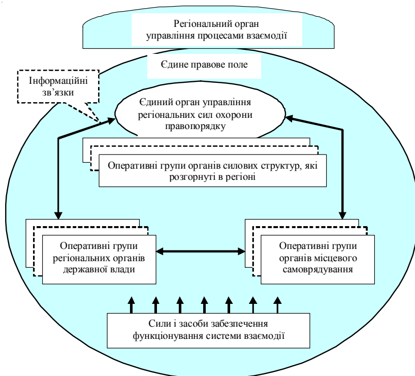
Рис. 1. Організаційна структура системи взаємодії регіональних органів виконавчої влади в сфері охорони правопорядку

Організаційна структура системи взаємодії регіональних органів виконавчої влади в сфері охорони правопорядку – це структура організації побудови системи у складі регіональних органів різного призначення, які функціонують у єдиному правовому полі, об'єднані спільними завданнями, пов'язані інформаційними зв'язками і функціонування цих органів забезпечується необхідними силами та засобами (рис. 1).