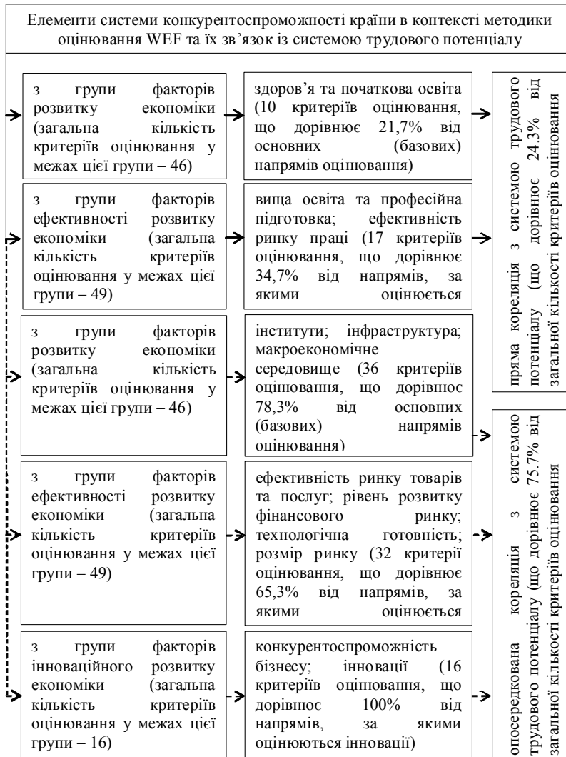
Рис. 3. Можливі напрями кореляції системи конкурентоспроможності держави з системою її трудового потенціалу в контексті методики складання індексу глобальної конкурентоспроможності

З усієї множини складових конкурентоспроможності країни (рис. 1) спробуємо виділити ті, які за своїм змістом можуть бути використані для характеристики трудового потенціалу. Ми розуміємо, що будь-який із чинників глобальної конкурентоспроможності має опосередкований зв'язок із системою трудового потенціалу, але існування такого зв'язку не може бути розглянуто як джерело взаємодії системи конкурентоспроможності країни з системою її трудового потенціалу. Водночас серед складових системи конкурентоспроможності країни ми можемо визначити ті елементи, які, на нашу думку, мають безпосереднє відношення до системи її трудового потенціалу. Кореляція системи конкурентоспроможності держави з системою її трудового потенціалу подана на рис. 3.