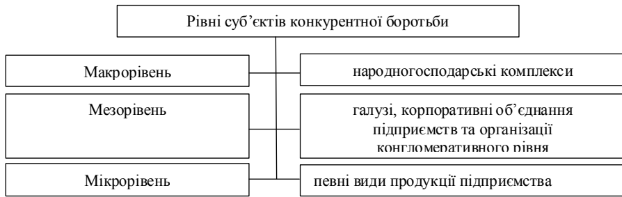
Рис. 1. Рівні конкурентної боротьби між суб'єктами ринку

Відповідно, економічна ефективність як “досягнення найбільших результатів за найменших витрат живої та уречевленої праці” [4] на зазначених рівнях визначається величиною затрат на виробництво одиниці: національного доходу (на макрорівні); доходу регіону/території чи виробленого продукту в галузі (на мезорівні); продукції/послуги підприємства (на мікрорівні).