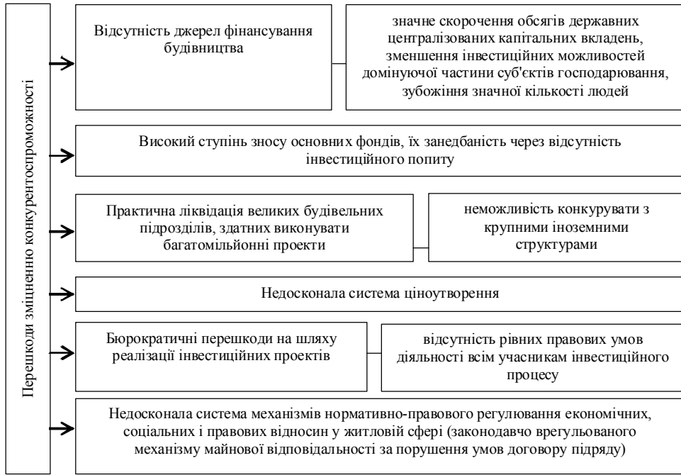
Рис. 3. Чинники, що перешкоджають зростанню рівня конкурентоспроможності будівельної галузі

борг, а через ненаповнення бюджету платежі не проводяться, часто фінансування взагалі припиняється і будівельні організації банкрутують [16].