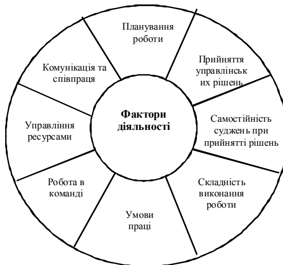
Рис. 3. Фактори діяльності

Описи посад, які належать до відповідних підгруп, склалися відповідно до 8 факторів (рис. 3).