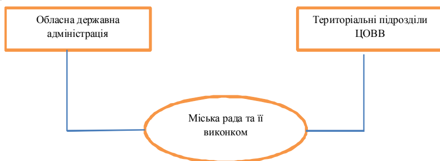
Рис. 2. Взаємодія міської ради з органами виконавчої влади

МРВ-2 (взаємодія органів місцевого самоврядування з органами виконавчої влади): проблеми взаємодії стосуються розподілу та делегування повноважень, підзвітності та підконтрольності, дублювання функцій. Ці питання є предметом досліджень багатьох відомих вчених, і в державному управлінні є широко висвітленими, тому не будемо зупинятися на них детально [3 – 6]. Зазначені проблеми полягають у сфері взаємодії між органами виконавчої влади та місцевого самоврядування одного рівня, як-от районна рада та райдержадміністрація, обласна рада та обласна державна адміністрація. У теорії державного управління достатньо довго відбувається дискусія щодо подальшого напрямку реформування таких відносин, йдеться про ліквідацію однієї з цих двох структур [7, 8]. Модель взаємодії органів муніципальної влади з органами виконавчої влади зображено на рис. 2.