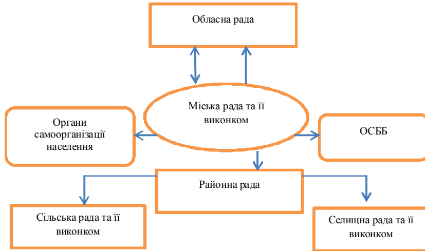
Рис. 1. Взаємодія органів місцевого самоврядування між собою

МРВ-1 (взаємодія органів місцевого самоврядування між собою): проблеми взаємодії в цьому секторі полягають у слабкості структурних зв'язків або їх відсутності між органами місцевого самоврядування різних рівнів, що зображено на рис. 1.