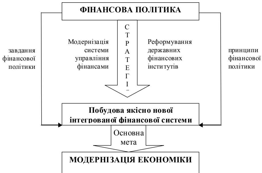
Рис. 2. Концептуальна схема спрямування фінансової політики у процесі модернізації економіки України

Досягнення стратегічних цілей державної фінансової політики має ґрунтуватись на сучасній системі управління державними фінансами як ключовій ланці фінансових відносин країни. Її модернізація передбачає створення цілісної інституційної системи з чітким розподілом функцій та відповідальності між її суб'єктами, з подоланням фрагментарності в роботі та ефективним використанням грошових ресурсів. Загалом, фінансова політика держави повинна здійснюватися за схемою, зображеною на рис. 2.