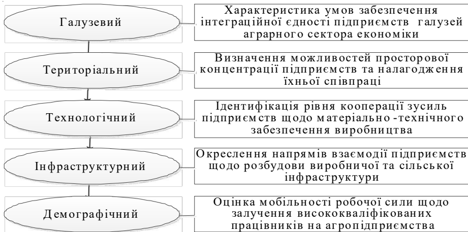
Рис. 2. Структурні зрізи інституціонального середовища в аграрному секторі економіки України

Сучасна конфігурація взаємодії економічних агентів в аграрному секторі, на нашу думку, може бути представлена як багаторівнева ієрархія з виділенням відповідних структурних зрізів інституціонального середовища: галузевого, територіального, технологічного, інфраструктурного та демографічного, що дають змогу визначити рівень і тип взаємодії між учасниками та, відповідно, з'ясувати необхідний набір інструментів державного регулювання (рис. 2).