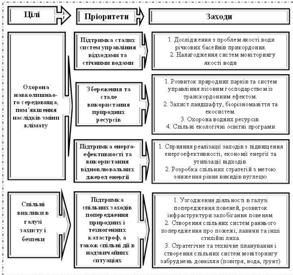
Рис. 1. Структурна схема програми трансграничного співробітництва Угорщина – Словаччина – Румунія – Україна 2014 – 2020