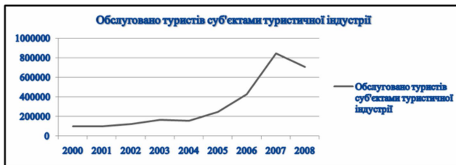
Рис. 3. Кількість туристів, обслугованих суб'єктами туристичної діяльності [9,10,11]

На протязі 2000-2007 років ринок демонстрував зростання за всіма основними показниками. Збільшувалася кількість відпочиваючих, частка іноземних громадян в складі відпочиваючих, посилювалося просування продукту на зовнішній і внутрішній ринок. За 2008 рік суб'єктами туристичної діяльності регіону було обслуговано 708947 осіб, в тому числі 8688 іноземних туристів, 650547 внутрішніх туристів та 49712 громадян України, які виїжджали за кордон. З рисунку 3 видно, що у 2007 році в регіоні було обслуговано найбільше туристів.