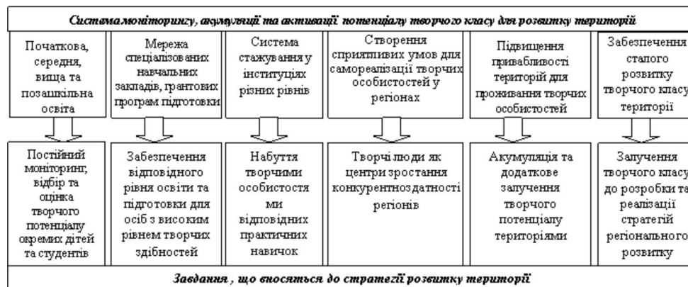
Рис. 4. Система моніторингу, акумуляції та активації творчого класу як елемент стратегічного планування розвитку територій

Тому для забезпечення ефективності реалізації стратегій регіонального розвитку на даному етапі та у майбутньому необхідним є створення системи моніторингу, акумуляції та активації творчого класу регіону (рис. 4).