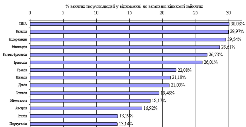
Рис.1. Частка творчого класу у структурі зайнятості розвинених країн, % зайнятих у сфері творчих індустрій у відношенні до загальної кількості зайнятих.

Особлива увага щодо виявлення та залучення цього виду людських ресурсів приділяється розвиненими країнами. На рис. 1. наведено концентрацію представників творчого класу у структурі зайнятості окремих країн.