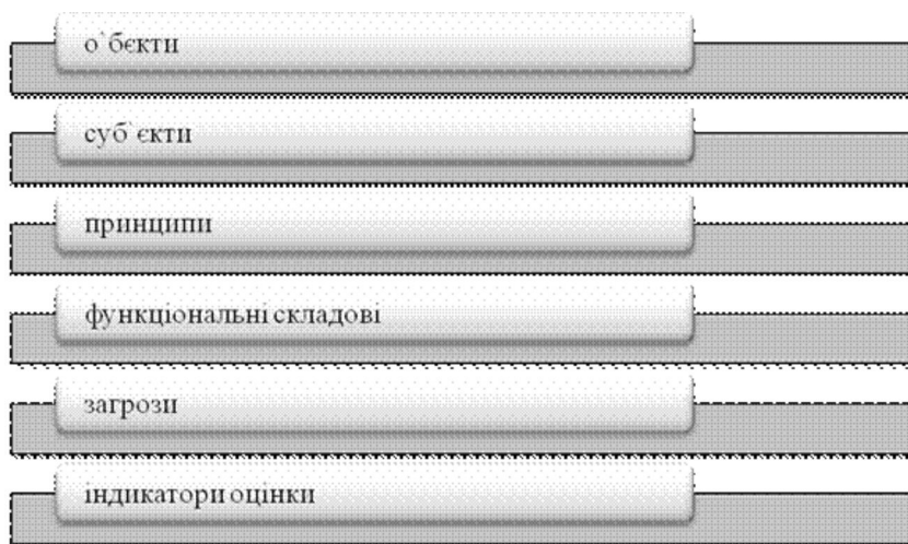
Рис. 1. Основні елементи системи економічної безпеки акціонерного товариства

На підставі проведеного дослідження основних елементів системи економічної безпеки, автором було запропоновано віднести до них наступні: об'єкти; суб'єкти; принципи; функціональні складові; загрози; індикатори оцінки (рис. 1).