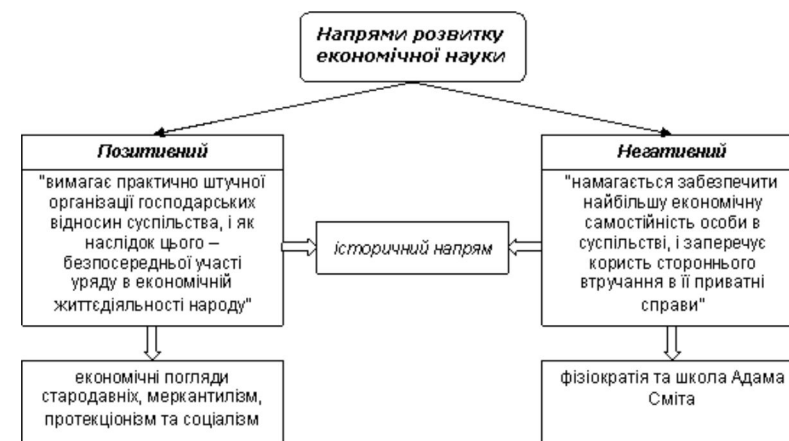
Рис. 1. Напрями розвитку економічної науки за І. Вернадським. 1

Український науковець був переконаним прихильником доктрини “laissez faire”, під цим кутом зору він й досліджував поступ економічної науки. Вернадський у розвитку економічної науки виокремив два основних напрями: позитивний та негативний (Рис. 1.). Даний поділ заснований на розумінні економічних законів та ролі держави в економіці. До позитивного напрямку він відносив “економічні погляди стародавніх, меркантилізм, протекціонізм та соціалізм; до негативного – фізіократію та школу Адама Сміта чи промислову” [3, с. 1], до якого відносить й себе Вернадський. Історичну школу вчений розміщував на межі між позитивним та негативним напрямками, вона уособлювала спробу їх примирення.