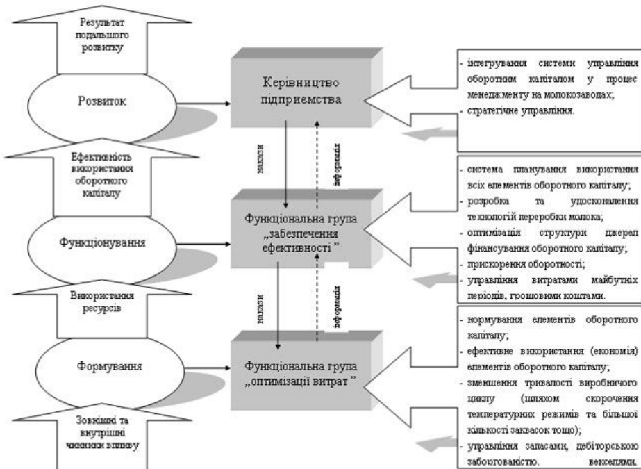
Рис. 1. Взаємозв'язки та основні функції функціональних груп „забезпечення ефективності” та „оптимізації витрат”

До кожної з вказаних функціональних груп необхідно залучити відповідних кваліфікованих працівників, яких наділити певними обов'язками. Що стосується функціональної групи „забезпечення ефективності”, то було розроблено, на прикладі ВАТ «Житомирський маслозавод», основні обов'язки її персоналу які наведено у табл. 1.