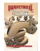
Журнал «Інвестиції: практика та досвід»