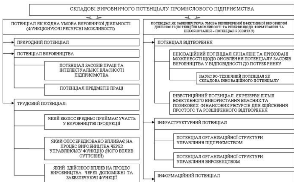
Рис. 2. Система формування та систематизація складових виробничого потенціалу промислового підприємства

Перша складова включає природний потенціал, потенціал засобів виробництва та трудовий потенціал. До другої складової потенціалу належить потенціал відтворення, під яким слід розуміти сукупність матеріальних, технічних, нематеріальних, фінансових та інших ресурсів, які перебувають у розпорядженні підприємства або можуть бути додатково залучені й використані для розширеного відтворення факторів виробництва та інших складових потенціалу; інфраструктурний потенціал та інформаційний потенціал.