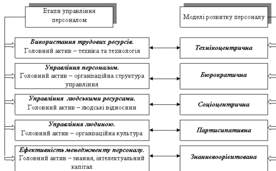
Рис. 1. Зв'язок між етапами управління персоналом та моделями його розвитку

Незважаючи на те, що в економічно розвинених країнах чітко простежується еволюція використання моделей розвитку персоналу, на вітчизняних підприємствах по-різному ставляться до специфіки цього процесу. Технікоцентрична модель розвитку передбачає акцентування уваги на розвитку не персоналу, а техніки та технології виробництва, використання “потогінної” системи організації праці, нівелювання уваги до потреб працівників. Основною метою розвитку виробництва виступає нарощення його обсягів, тоді як ядро персоналу складають низько- та некваліфіковані робітники, що не мають жодних соціальних гарантій з боку держави.