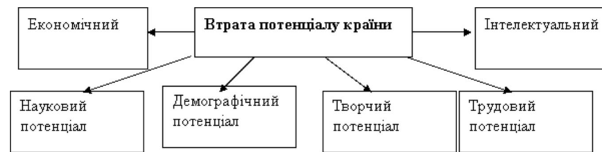
Рис.2. Структура потенціалу країни