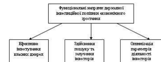
Рис.1. Функціональні напрями державної інвестиційної політики економічного зростання

Загальними функціональними напрямами реалізації державної інвестиційної політики мають бути наступні (рис. 1.)