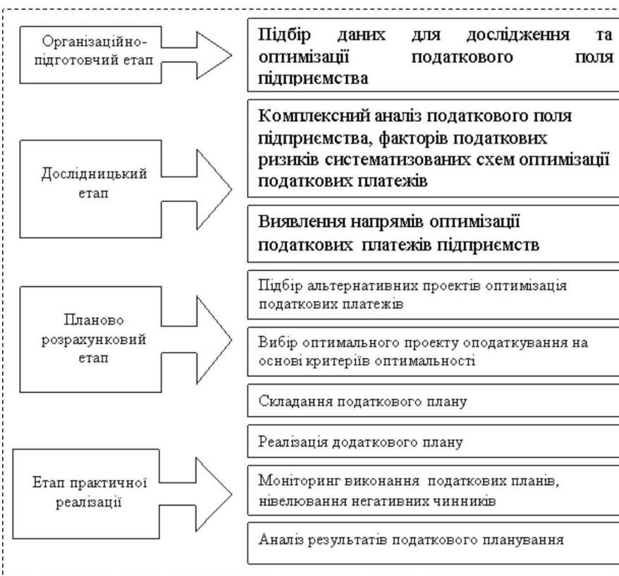
Рис. 3. Етапи і заходи за запропонованою методикою податкового планування на промисловому підприємстві

Етапи і заходи податкового планування за викладеною методикою наведено на рис.3.