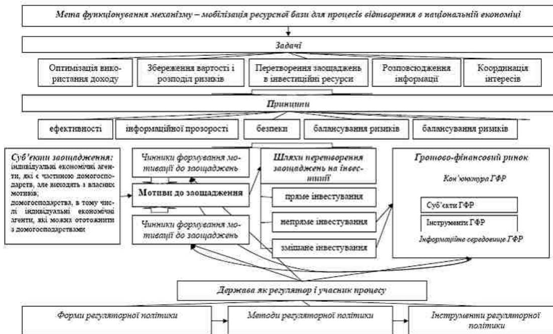
Рис. 2. Структура механізму трансформації заощаджень населення в інвестиції в національній економіці

В межах цього механізму доцільно виділити низку структурних елементів, зміст яких уточнено на підставі критичного аналізу існуючих теоретичних поглядів та теоретичному узагальненні досвіду функціонування грошово-фінансового ринку.