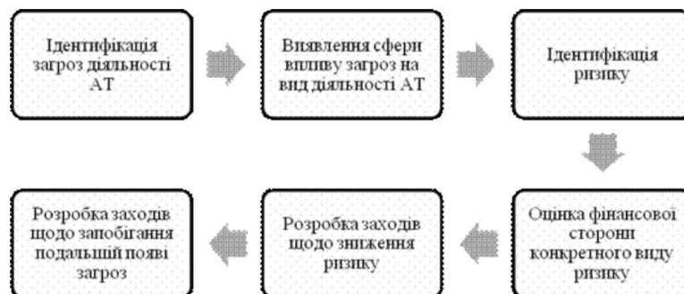
Рис. 2. Модель взаємозв'язку загроз діяльності акціонерного товариства та ризику втрати його фінансових ресурсів

Поняття «загроза», на думку авторів, являє собою певну подію, що впливає на діяльність суб'єктів господарювання, в тому числі й акціонерних товариств, тоді як «ризик» виступає результатом впливу загроз на господарську діяльність суб'єктів господарювання (рис. 2).