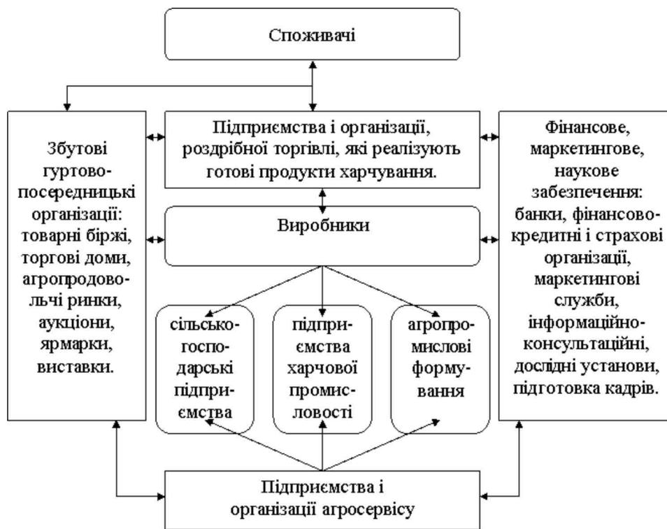
Рис. 2. Схема економічних взаємовідносин між суб'єктами аграрного бізнесу

Зі схеми видно, що всі учасники агробізнесу тісно пов'язані економічним інтересом, успіх будь-якого з них є неможливим без успішного функціонування всієї системи. Усі підприємства агробізнесу особливо тісно пов'язані із сільськогосподарськими виробниками, оскільки саме сільське господарство задає основні параметри діяльності, з одного боку, галузям з виробництва засобів виробництва, а з іншого – галузям з переробки сільськогосподарської продукції, а також суб'єктам інфраструктури аграрного ринку. Тому ефективне та високопродуктивне сільське господарство за агробізнесовою схемою організації базується на якісному технічному, фінансовому, маркетинговому та науковому забезпеченні. Саме завдяки агробізнесу сільське господарство економічно розвинутих країн досягло значного прогресу.