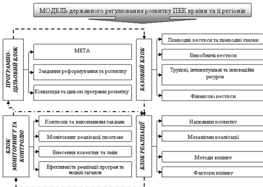
Рис. 2. Модель державного регулювання розвитку ПЕК країни та її регіонів *

Важливим питанням підвищення ефективного функціонування фер та галузей ПЕК країни та її регіонів є налагодження тісних господарських взаємозв'язків між усіма елементами територіально-галузевої структури ПЕК та розвиток її поступової інтеграції до міжнародних господарських систем. Такий сучасний підхід щодо розвитку ПЕК та системи його державного регулювання вимагає побудови відповідної моделі державного регулювання розвитку ПЕК (рис. 2).