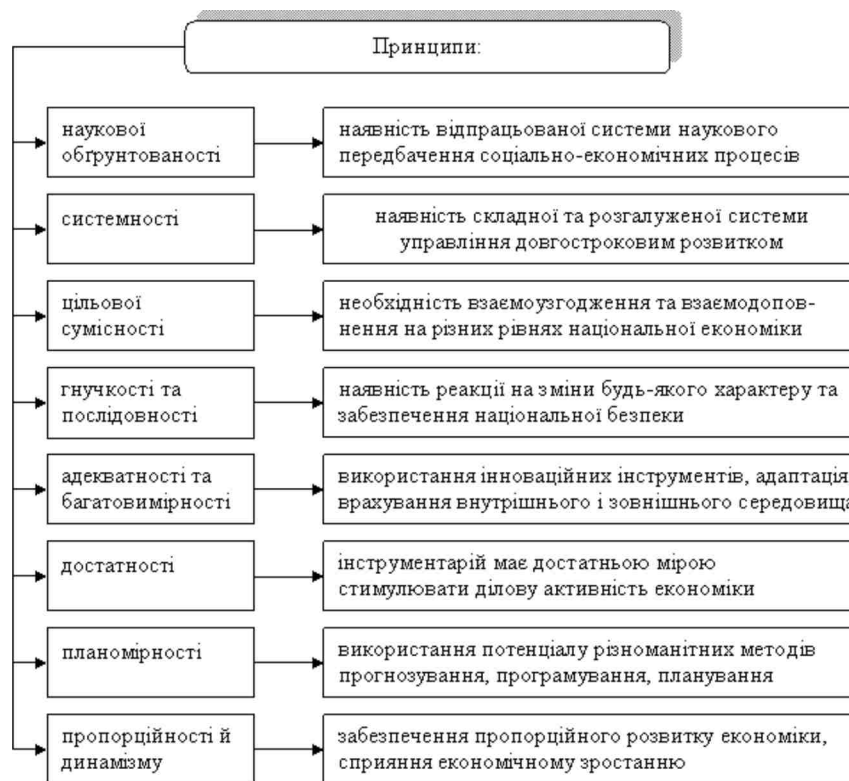
Рис. 1. Принципи довгострокового розвитку національної економіки*