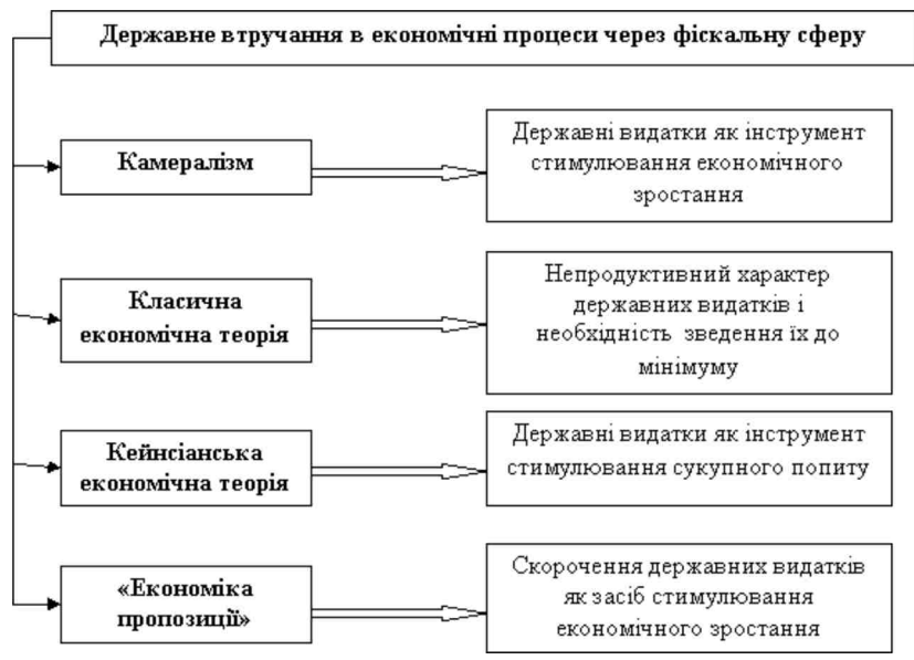
Рис. 1. Наукові підходи економічних шкіл до ролі державних видатків у забезпеченні економічного зростання

Результати. Для з'ясування внеску економічної науки щодо обгрунтування доцільності державного втручання в економічні процеси, зокрема у стимулювання економічного зростання, за допомогою фіску, слід розкрити зміст наукових підходів економічних шкіл (рис. 1).