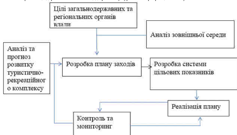
Рис. 2. Модель реалізації державної політики розвитку туристично-рекреаційного комплексу

На рис. 2 представлена схема реалізації державної політики щодо розвитку туристично-рекреаційної галузі.