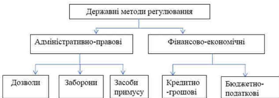
Рис . 1. Методи державного регулювання розвитку туристично-рекреаційного комплексу

правової інфраструктури. Вони обмежують рамки поведінки економічних агентів і часто носять суворий характер. Фінансово-економічні методи не обмежують свободу вибору надаючи суб'єктам туристично-рекреаційного комплексу право на вільне прийняття рішення.